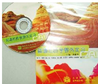
高等教育出版社出版的 《普通地质学野外实习课件》电子教材

桂林理工大学多媒体软件开发与应用研究所愿意成为国内高校学科信息化平台建设提供全套技术培训或设计制作，她是您有力的重要技术支持力量，随时为您服务。并且提供整个大学的全部网站整体策划与包装工程，提升学校的新形象、软实力、新文化。